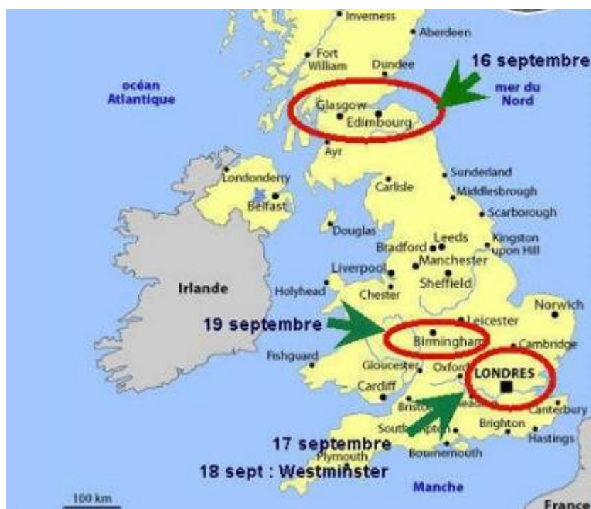
A visita de Ratzinger-Bento XVI à

Escócia e Inglaterra de 16 a 19 de setembro de 2010. Ela carrega um simbolismo maçônico e anglicano e começa com a visita a uma terra templária.