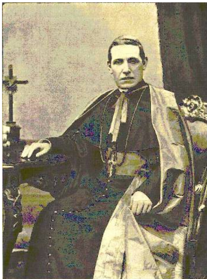
LE CARDINAL MARIEN RAMPOLLA DEL TINDARO