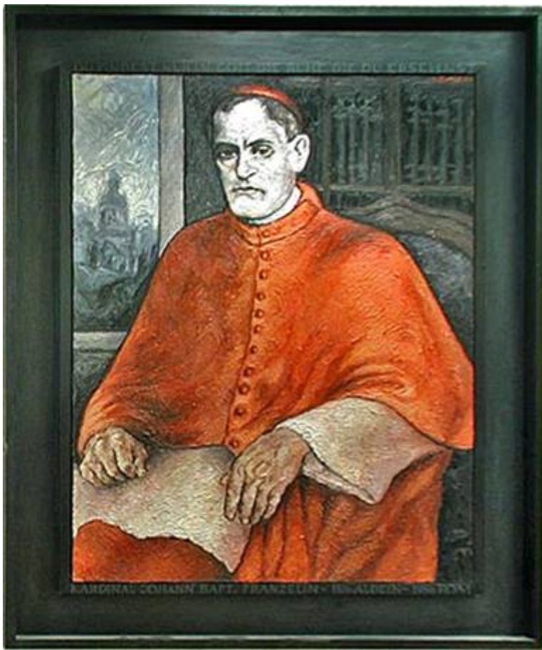
O Cardeal Franzelin

Essa manobra do cardeal satanista Rampolla e do padre traiçoeiro Portal falhará, pois em 1896 o Papa Leão XIII comprometeu sua infalibilidade pontifical para proclamar «absolutamente vãs e totalmente nulas» as ordenações anglicanas.