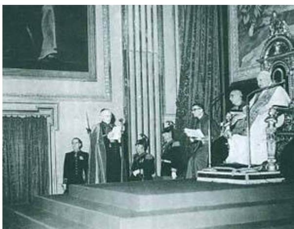
João XXIII em recepção solene. Ao fundo, dois Guardas nobres e um Camerlengo de honra

In Rome and throughout Italy the rumor is out that Montini would be a homosexual. Hence, vulnerable. Hence, open to those who aim to use him to achieve their own goals.