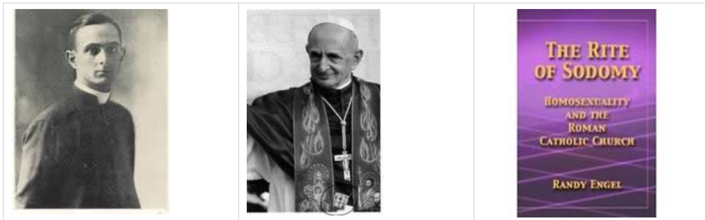
Foto de Montini em 29 de maio de 1920 para sua ordenação presbiteral (Brescia).

Capítulo 19 - "O Papa Paulo VI e a mudança de paradigma da Igreja em relação à homossexualidade" Extraído do livro "O Rito de Sodoma: Homossexualidade e Igreja Católica Romana" (1282 páginas, julho de 2006, Randy Engel)