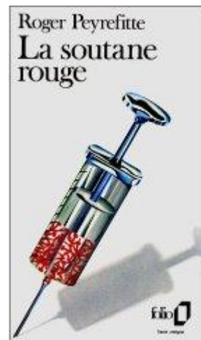
Duas edições de 'A Sotaina Vermelha', o livro à chave de Roger Peyrefitte