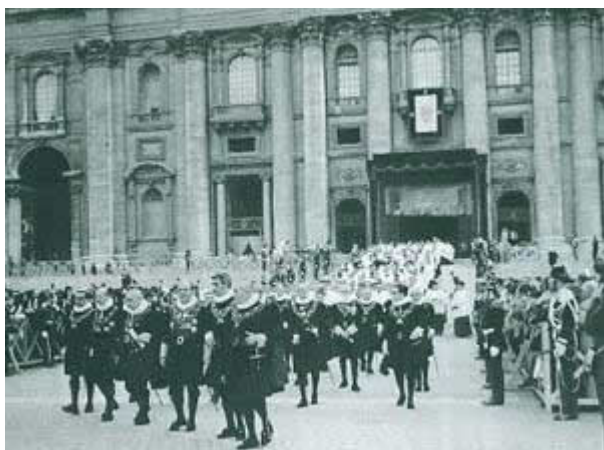
O corpo dos Camerlengos de honra - camarieri di spada i cappa - usando seu grande uniforme durante uma procissão de Corpus Christi