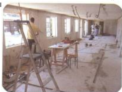
Travaux dans le réfectoire de l'hôtellerie