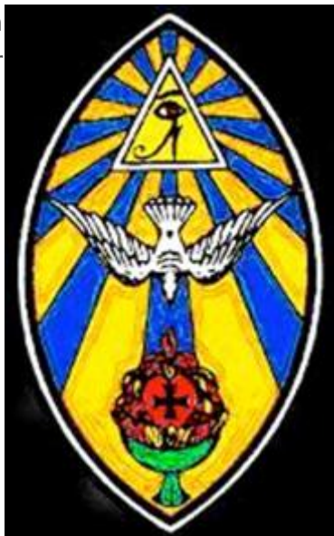
Brasão da OTO

Este trecho traduz, portanto, o compromisso de declarar guerra contra os cristãos "quando o momento chegar", e como a OTO planeja a sua expansão global, indo da Itália à América do Sul, passando pela Croácia, Japão e Nova Zelândia, os cr