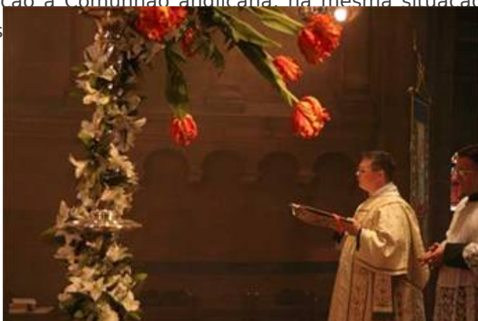
Epístola e Evangelho em uma «missa»

Desde esse desenvolvimento da High Church, a Comunhão Anglicana conheceu uma deriva liberal que dá lugar a todos os excessos: ordenação de mulheres sacerdotes, consagração de mulheres bispos, clérigos ostensivamente homossexuais, etc. De modo que o TAC se encontra hoje, em relação à Comunhão anglicana, na mesma situação da High Church em relação ao anglicanismo ress