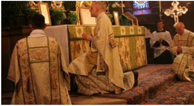
Último evangelho em uma «missa» anglicana