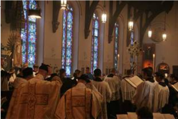
Procissão de saída em uma «missa» anglicana