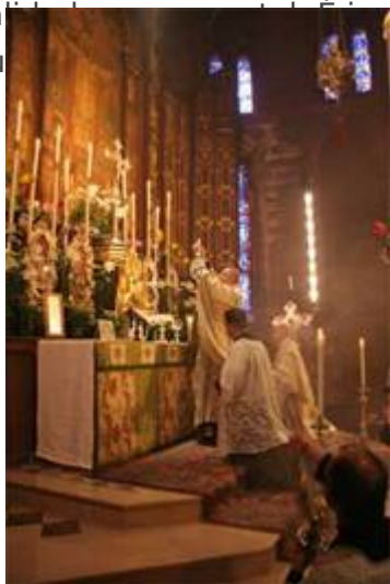
Falsa elevação em uma "missão" anglicana inválida (Filadélfia