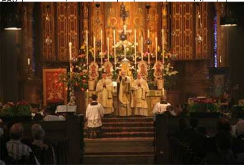
«Ecce Agnus Dei» em uma «missa»