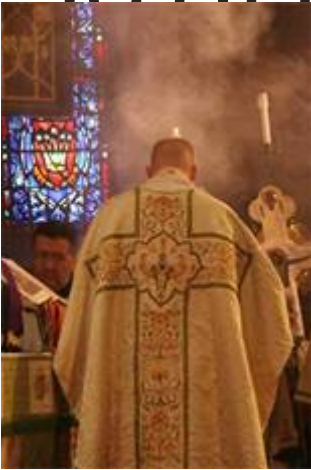
Incenso de um diácono em uma « missa » anglicana inválida