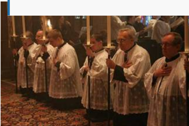
Portadores de candeias em uma «missa»

“«Um nó une dois elementos do pensamento ratzinguiano:, por um lado, uma crítica implícita, em forma de "boa interpretação", da reforma de Paulo VI, ao menos como se desenvolveu no campo; e, por outro lado, um desejo mais ou menos acentuado, conforme o caso, de "ecumenismo" em direção ao mundo tradicional, considerado como um conservatório da liturgia e da doutrina de "antes".» Padre Barthe, 20 de novembro de 2006