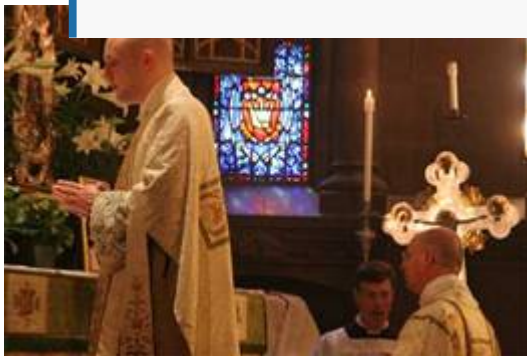
Orações no altar após a leitura do Evangelho em uma

“ «Buscamos desenvolver e seguir um espírito que não é muito diferente do que o papa Bento XVI claramente procura promover - isto é, o espírito litúrgico em uma Igreja fiel à mensagem de Cristo, espiritual e missionária.» Reverendo Chadwick